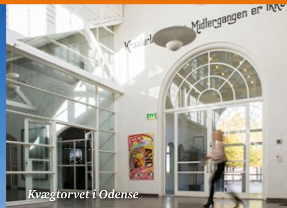
Kvægtorvet i Odense